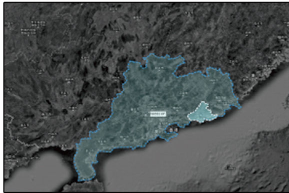
汕尾市在广东省的位置