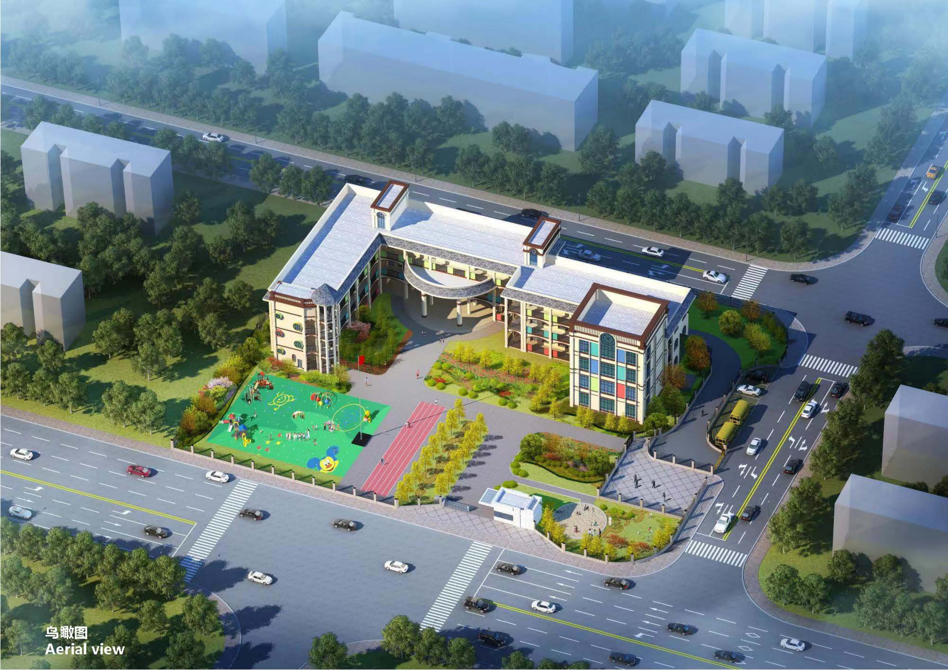
鸟瞰图 Aerial view