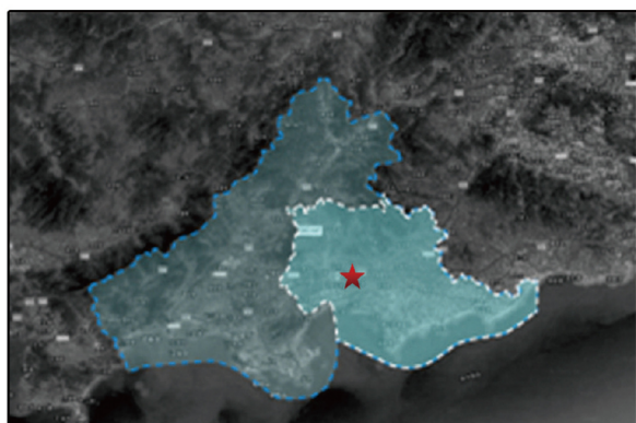
陆丰市在汕尾市的位置