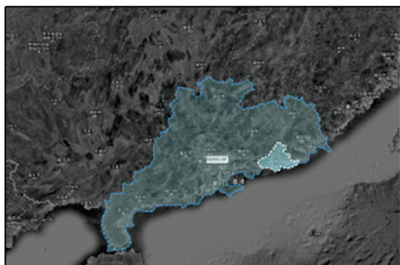
汕尾市在广东省的位置